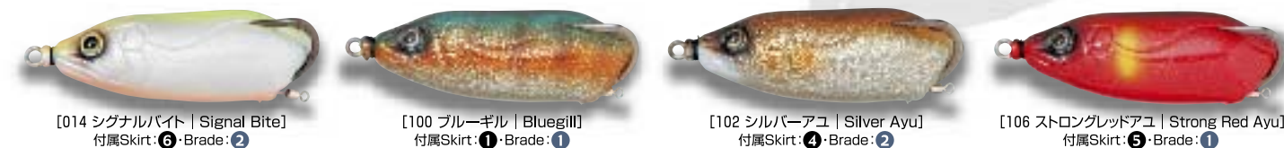
[014 シグナルバイト | Signal Bite] 付属Skirt: ⑥・Brade: ②