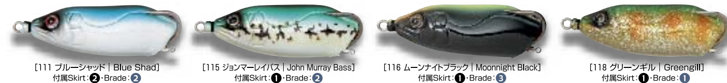
[111 ブルーシャッド | Blue Shad] 付属Skirt: ②・Brade: ②