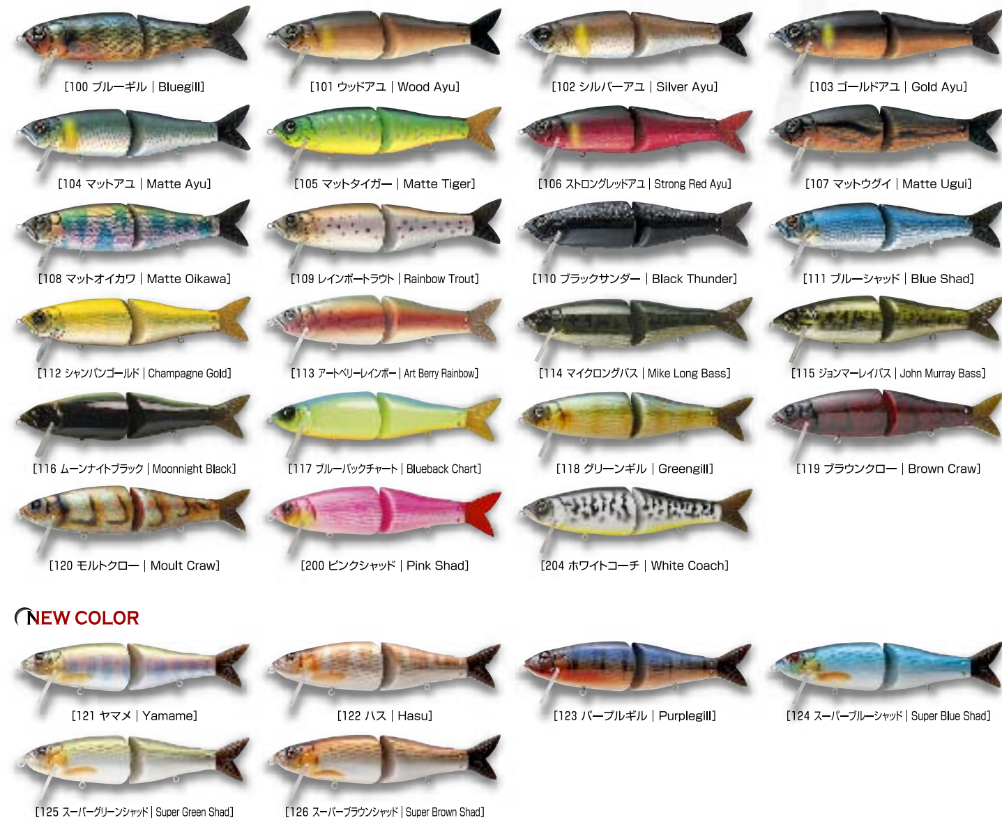
Monster Jack パープルギル