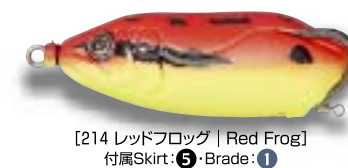
[214 レッドフロッグ | Red Frog] 付属Skirt: ⑤・Brade: ①