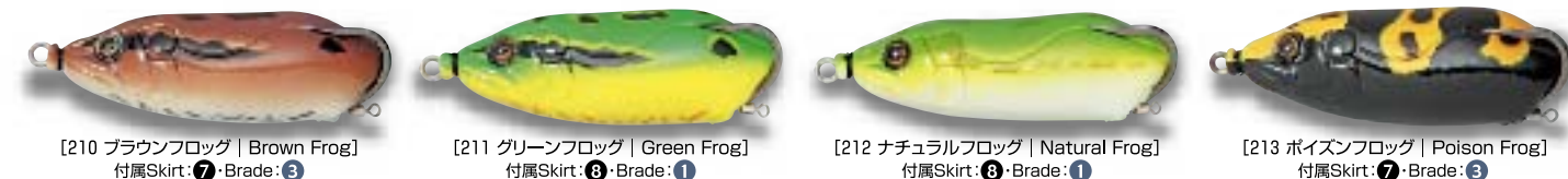
[210 ブラウンフロッグ | Brown Frog] 付属Skirt: ⑦・Brade: ③